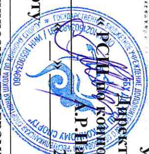
График проведения ОФП и СФП в ГБУ ДО РСИП по конному спорту